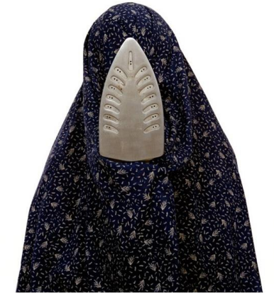
Shadi Ghadirian. Like Everyday. 2001