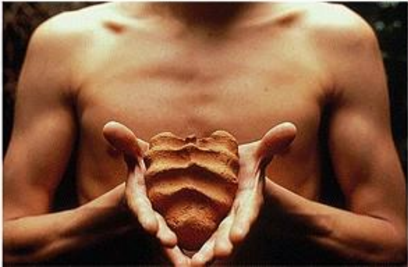
Gabriel Orozco. My hands are my heart. 1991