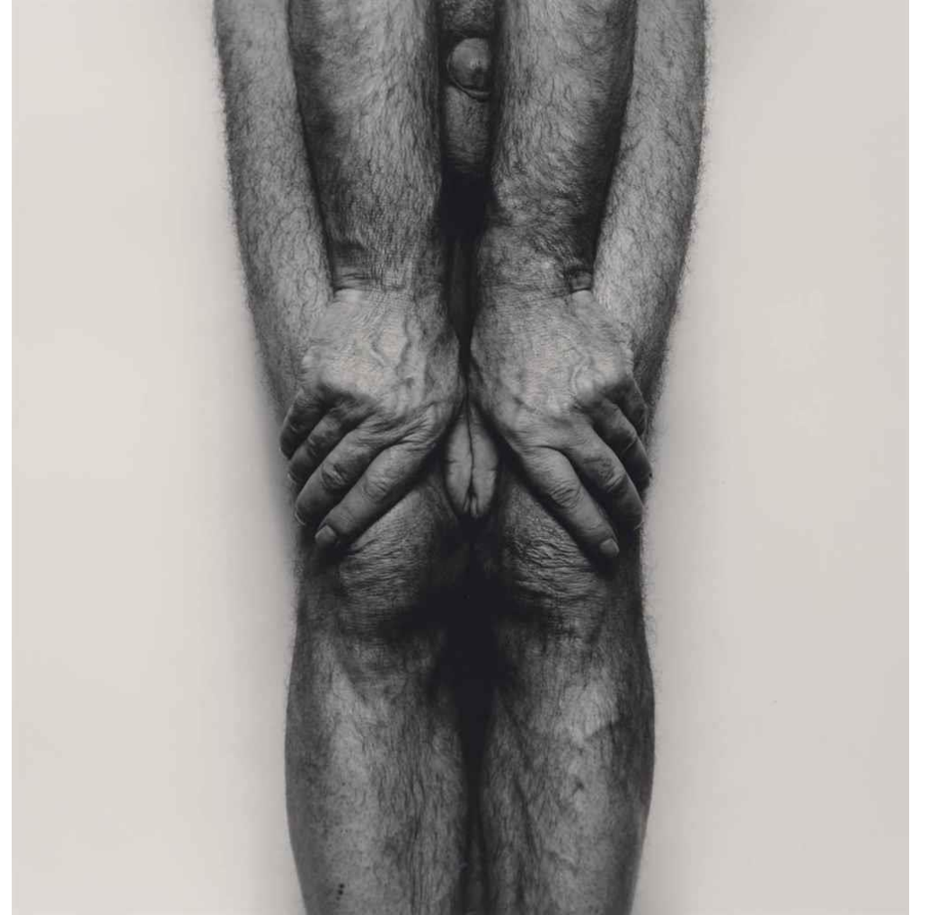
John Coplans. Self portrait. 1985