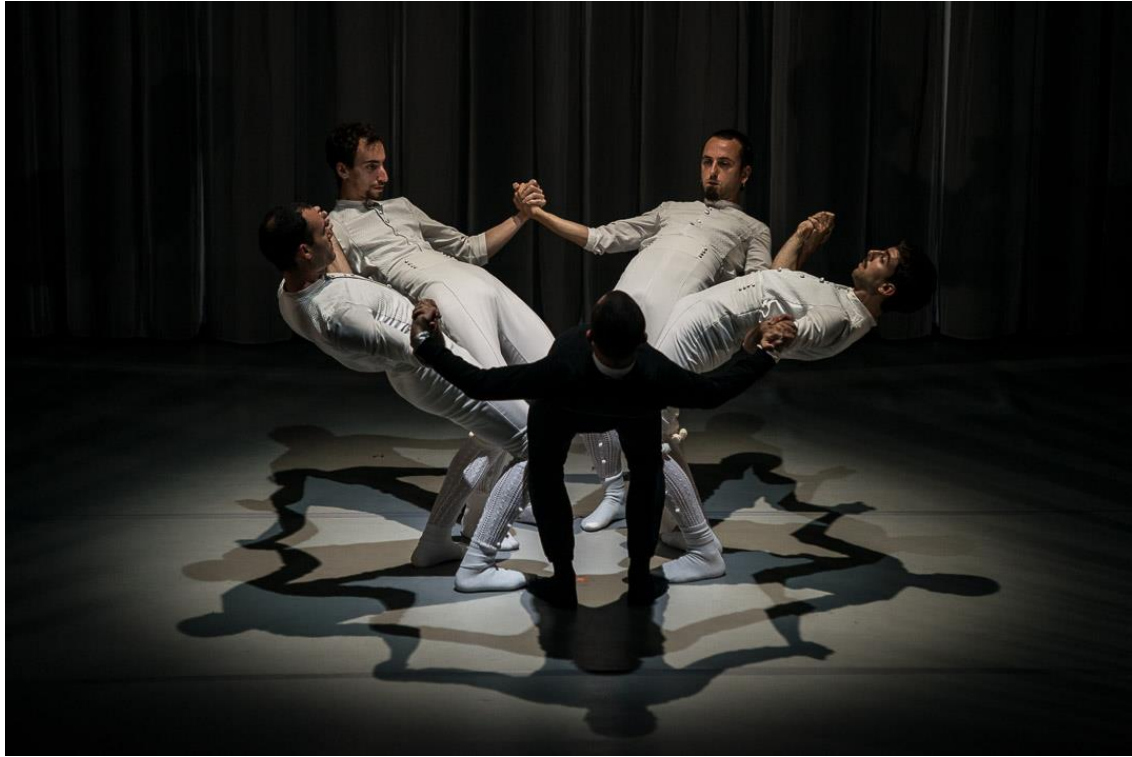
Kukai Dantza. Oskara.2017