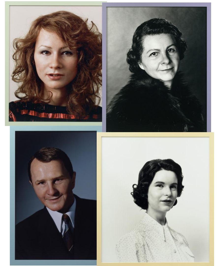
Gillian Wearing. Album. 2003