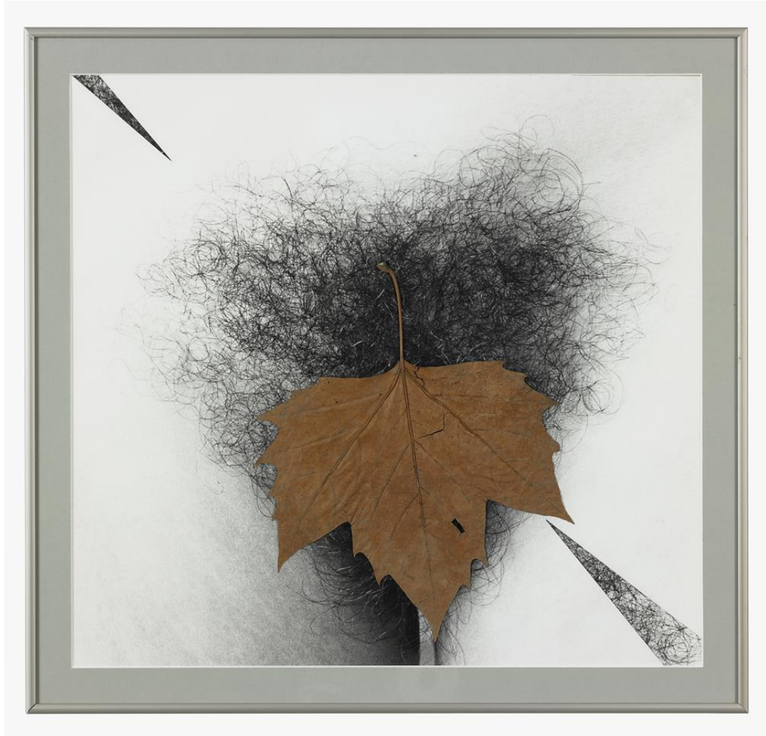
Esther Ferrer. Libro del sexo. La caída. 1983