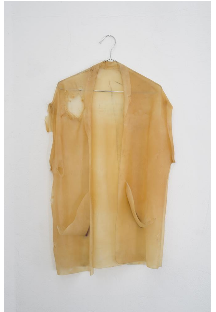
Angels Ribé- 3 punts 2. 1970