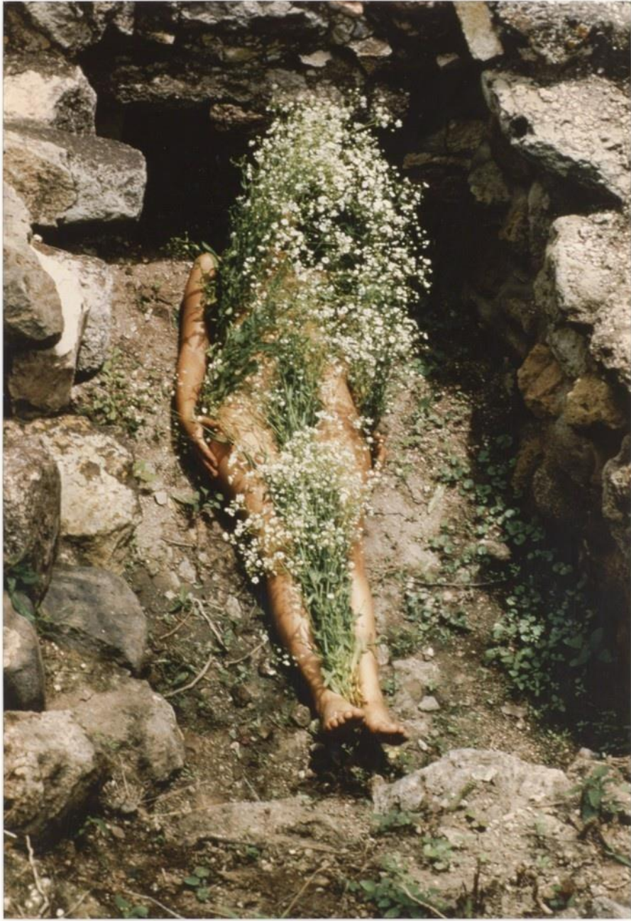
Ana Mendieta- Flowers on body 1973