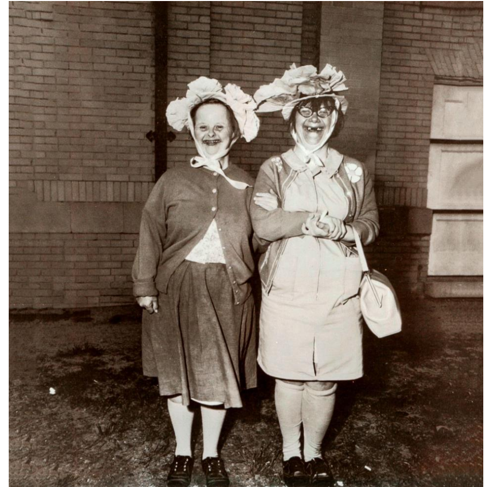
Diane Arbus. Década de los 60.