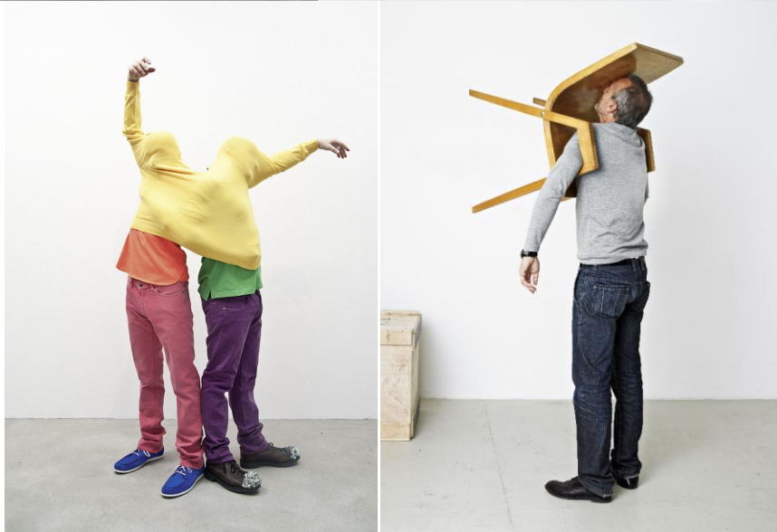
Erwin Wurm. One Minute Sculpture. Desde los 90.