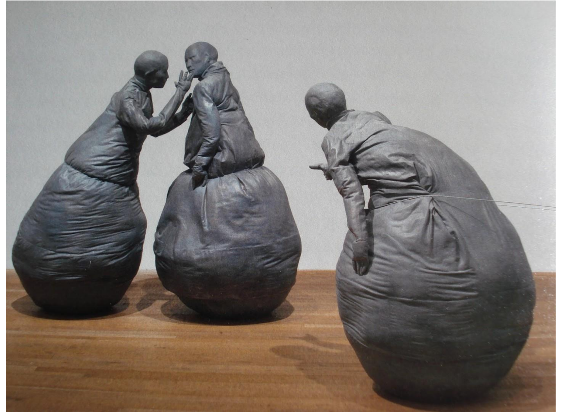
Juan Muñoz. Conversation piece.2001