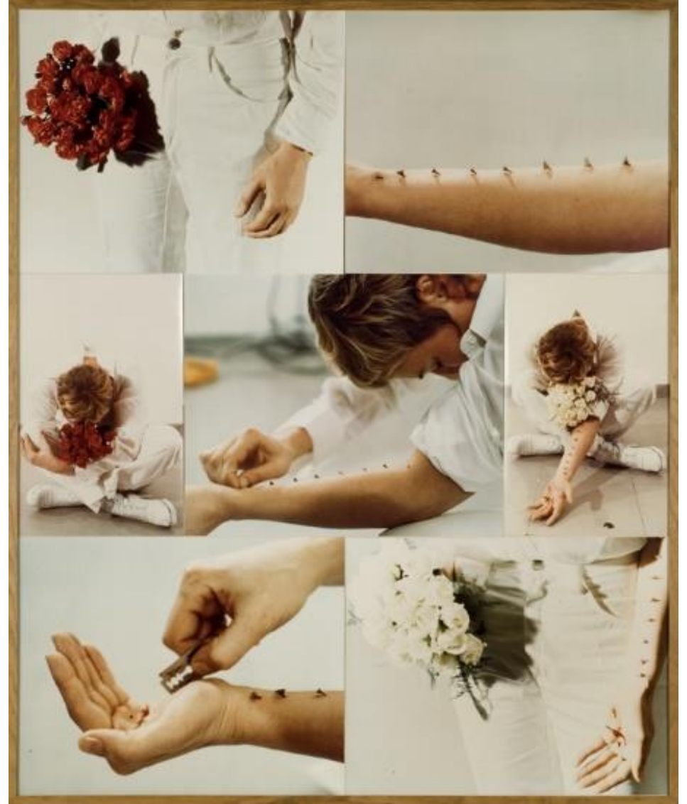
Gina Pane. Acción sentimental. 1973