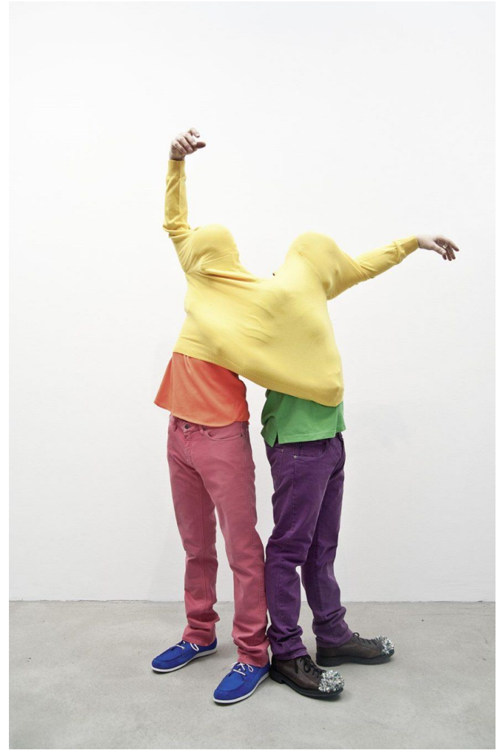
Erwin Wurm. One Minute Sculpture. Desde los 90.