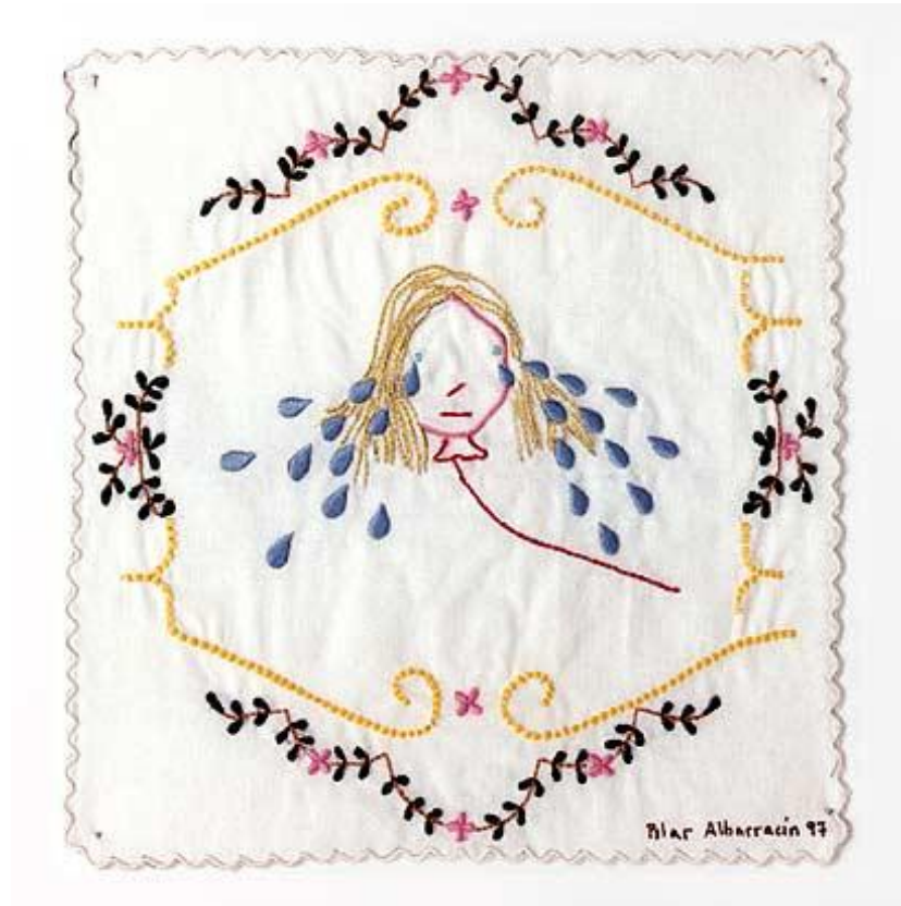
Pilar Albarracín. Pañuelos para llorar. 1997