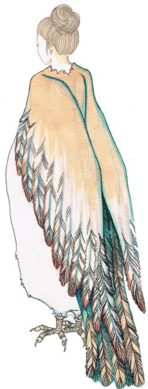
Leire Urbeltz. Mujer águila.